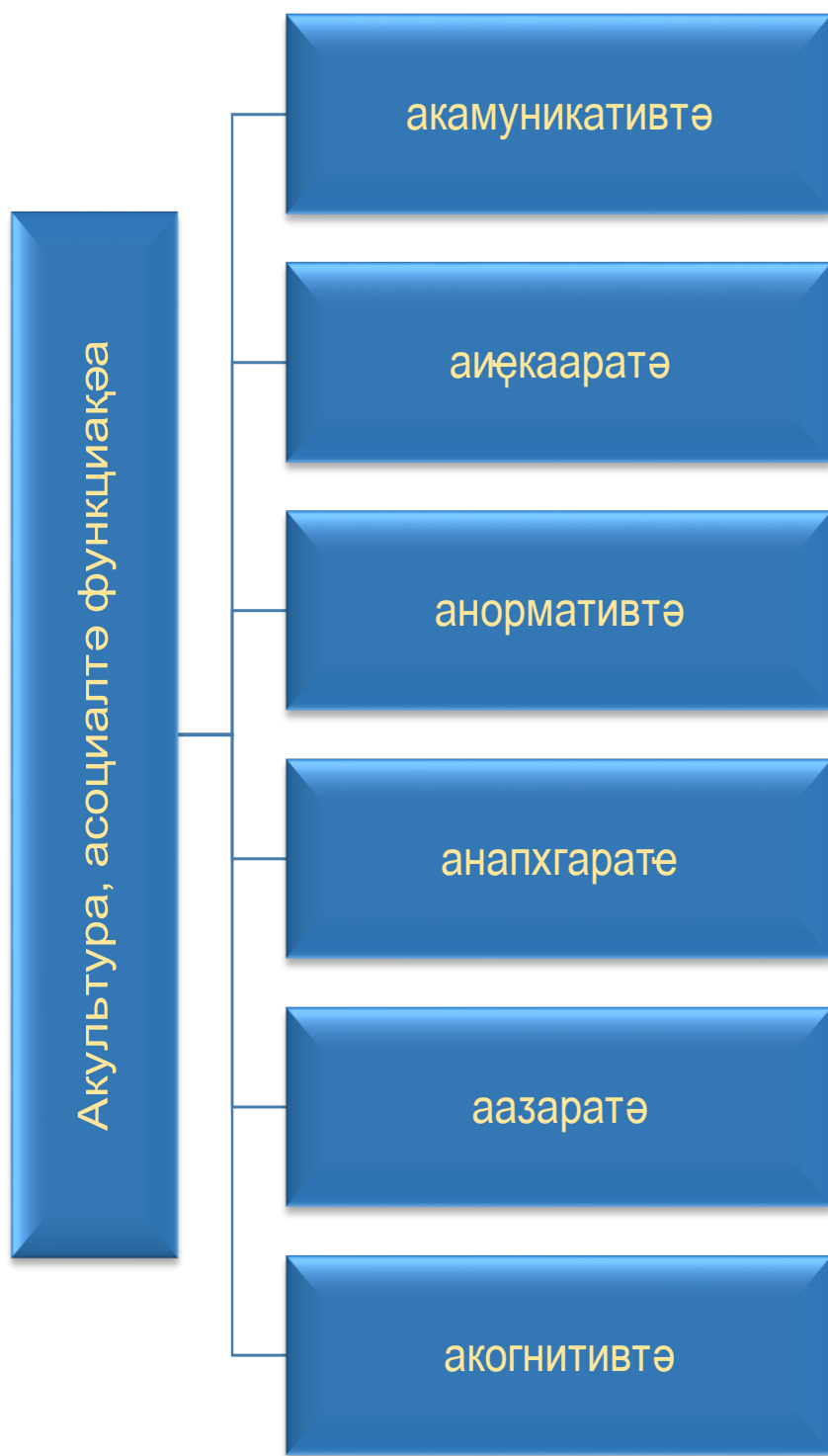
Асахьа 3. Акультура афункциақеа