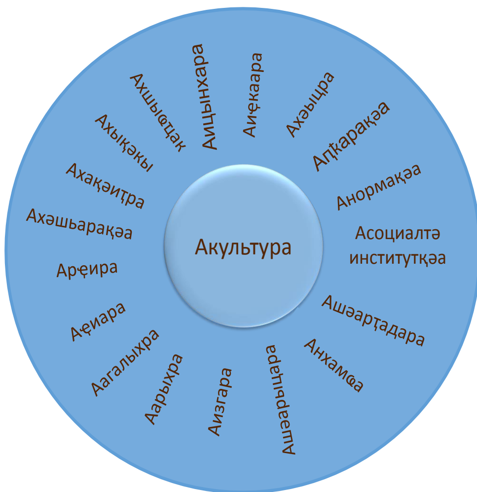
Асахьа 2. Акультура акатегориакәә рсистема