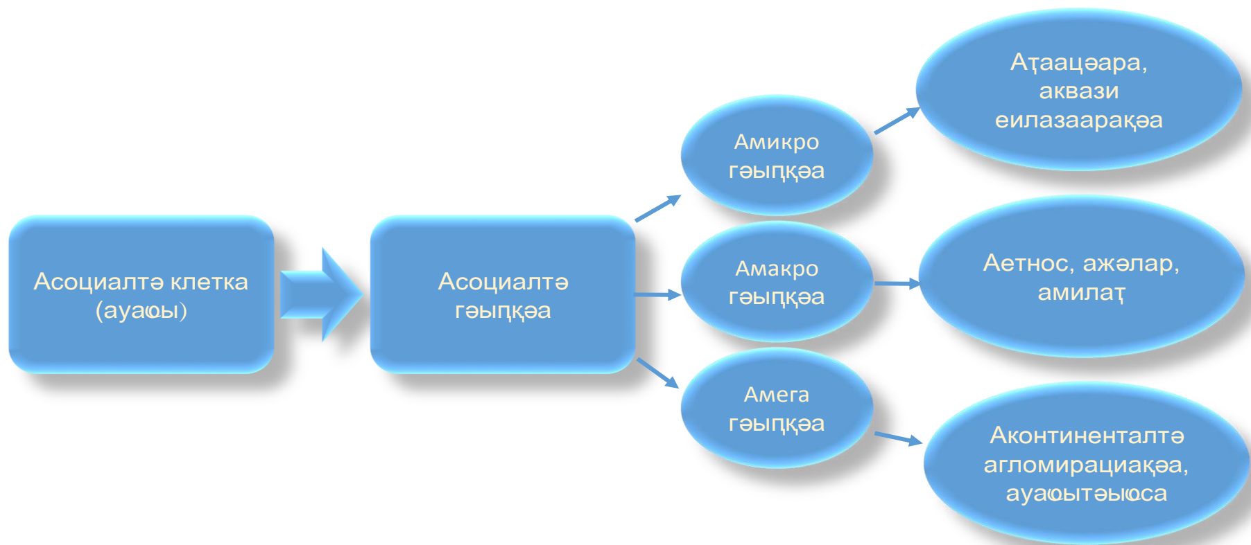
Асахьа 1. Асоциалтә еилазаара аструктура