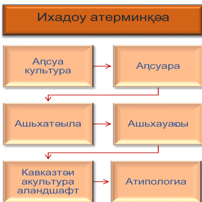
Асахьа 1. Ихаду атерминқәа

Хыхь иаххәаз, инагзаны акәымзаргы, ианыңшуеит кавказтәи акультура атип ашьақәгыларәы ақсабара «иканақоз ацхыраара». Аха ари иаанагом кавказтәи акультура атип аарңшра қсабарала мацара азнеира азхоит хәа. Ақсабара иканақоз арака, җақхьа иацшыны иазгәахтап, ацхыраара акәын, акультура зыреиоз – ауаа ракәын. Амала убри аамтазы ақсабара ирзыңнацәаз аңкарақәеи, анормақәеи ирықәныкәон. Ус анакәха, кавказтәи акультура, ақсуа культурагы налацаны, атипология азцаара ахцәажәара макъаназ инагзазам. Уи җақхьа хәқхьака хазыхынхәыр акәхоит.