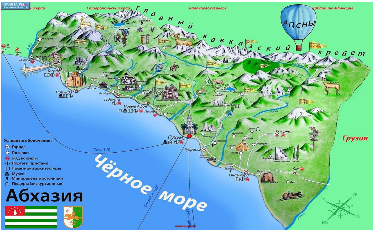
Асахыа 3. Апсны ахсаала